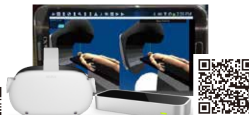
放射線治療装置の寝台操作と患者の姿勢合わせを二人組で行う：患者に触れる回数を減らし短い時間で行う訓練