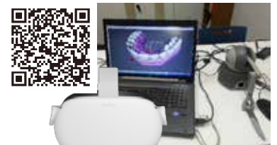
虫歯治療 (歯を削る) の練習：触力覚デバイス (Phantom) を歯科ドリルとして使用