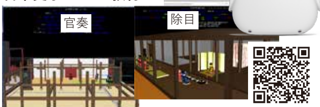
古文書 (平安時代の宮中儀礼 (官奏、除目)) の読解 宮中諸官の振る舞いを3次元CGアニメーションで表現 ⇒ 「古文書の内容をより深く理解できた」という学生の感想

# 官奏：諸司・諸国からの上申文書を大臣が天皇に奏上 # 除目：諸官を任命すること、またその儀式自体